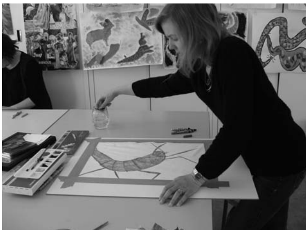
Les stages sont ouverts aux débutants comme aux avancés. Ici, le stage Cheminement créatif