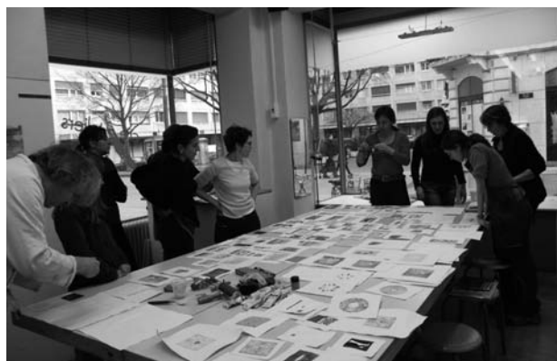
Les créAteliers sont restés ouverts pendant 24 samedis ou dimanches pour des stages, des après-midi enfants-adultes et pour des animations gratuites. Ici stage Gravure qui a lieu deux fois dans l'année.