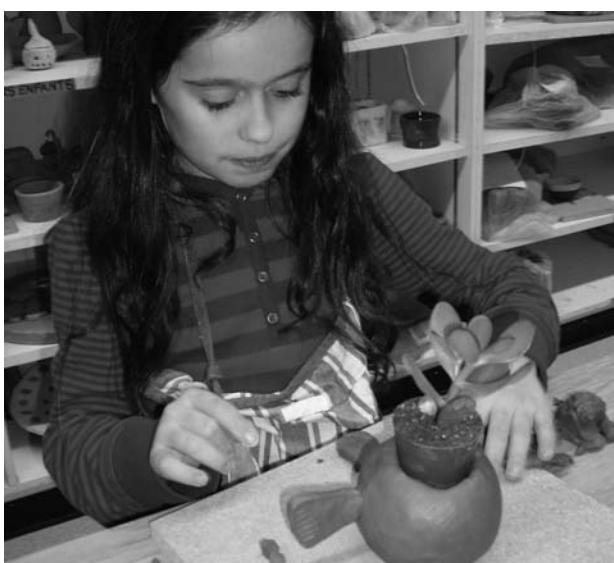
L'atelier poterie, pour les enfants dès 6 ans, a lieu tous les jours.